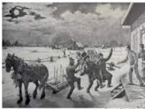
Le mardi gras...

Aujourd'hui, le Mardi gras n'occupe plus une place centrale au Québec, mais il survit dans la mémoire culturelle. Héritage modeste mais profondément humain, le Mardi gras rappelle une époque où l'excès, le rire et la fête précédaient volontairement le temps de la retenue.